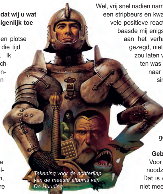
Tekening voor de achterflap van de meeste albums van De Huurling

Voor mijn werk als illustrator is het absoluut noodzakelijk bruikbare documentatie te vinden. Dat is een lastig werk en dat probleem wilde ik niet meer hebben als striptekenaar. Juist daarom