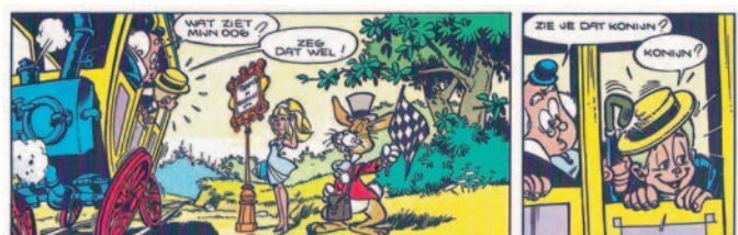
▲ Fragment uit verhaal 1 : Roze Bottel ziet Duifje voor het eerst

Ik zou niet durven zeggen dat er geen verhaal van Roze Bottel meer zal komen in de toekomst. Ik heb trouwens een afgewerkt scenario in mijn schuif liggen, Le Pays des Mille et un Ennuis .