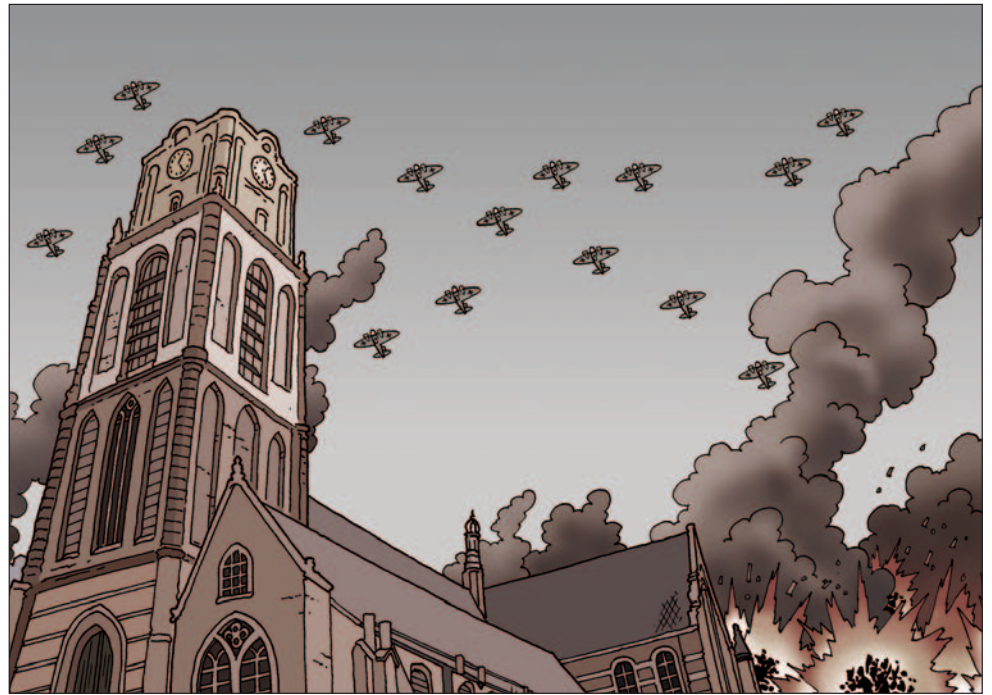
▲ Covertekening voor Frontstad Rotterdam , uitg. OorlogsVerzetsMuseum Rotterdam, 2006