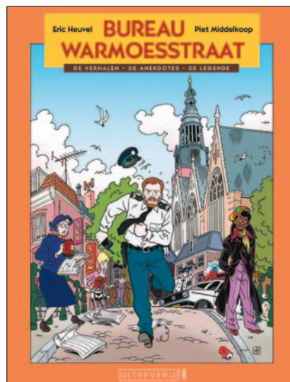
▲ Cover Bureau Warmoesstraat

Onlangs ging het gerucht dat je gezegd zou hebben: “Dan moet ik de tekenpen maar aan de wilgen hangen.” Wat was er gebeurd?