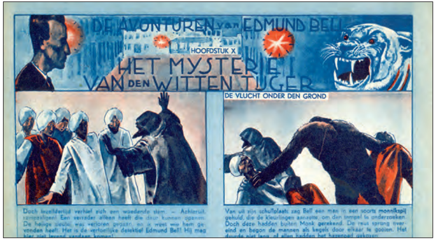
Edmund Bell, geschreven door John Flanders en getekend door Frits Van den Berghe, een curiosum dat hopelijk ooit nog eens in album verschijnt (3de jg., nr. 13)