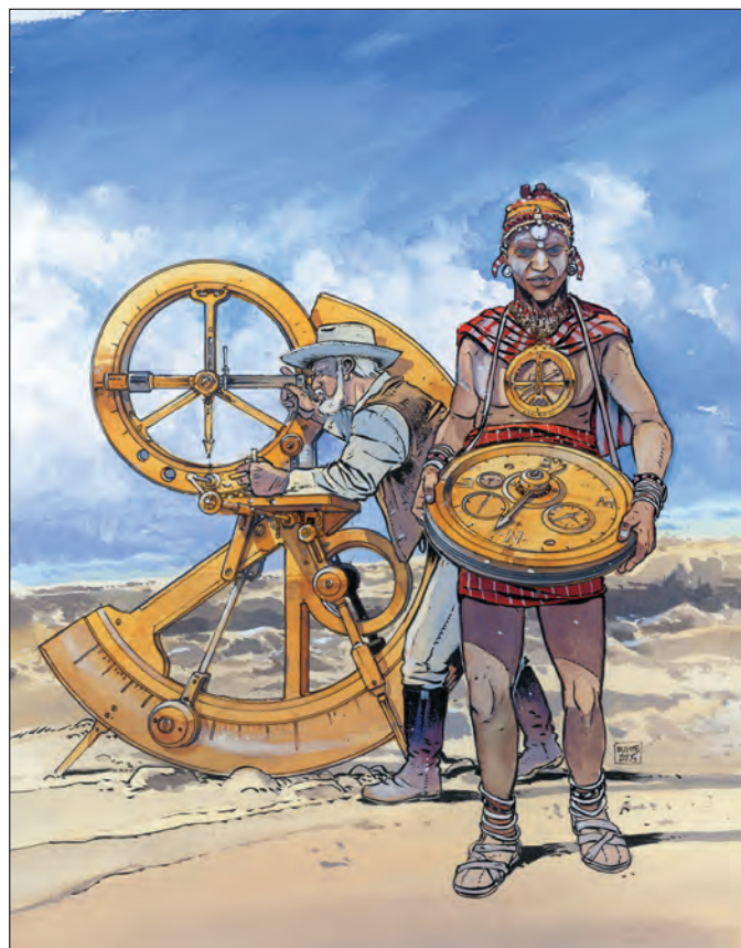
▲ Studie uit een Neptunusverhaal