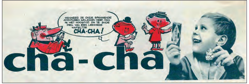
▲ Pagina uit een album, met reclame voor Cha-Cha, op de markt gebracht door het Belgische Parein-De Beuckelaer (vandaag opgegeven door het Franse LU)

Reclame is erg vluchtig. Wat vandaag hip, modern en onmisbaar lijkt in je dagelijkse leven, is morgen alweer voorbijgestreefd. Het gaat steeds sneller, het wordt alsmaar gekker. Geen zinnig mens die omheen reclame kan, handige reclamejongens vinden steeds een nieuw object dat je kan bekoren. Je vindt reclame op de meest mogelijke en onmogelijke plaatsen in het straatbeeld. Wie toch probeert te ontsnappen aan deze in het oog springende vloedgolf, wordt bedolven onder advertenties die je dagelijks toegrijzen bij het lezen in een krant of tijdschrift, of op internet. Kortweg gezegd : commercie ten top.